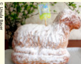
Auch ein Lamm aus Kuchenteig ist ein leckerer Ostergenuss.

Unter den Käfigen sammeln sich Exkremente, deren Ammoniakdämpfe und Krankheitserreger zu Augen- und Atemwegserkrankungen führen können. Statt ihrer natürlichen Lebenserwartung von bis zu zehn Jahren werden Mastkaninchen bereits nach etwa drei Monaten geschlachtet.