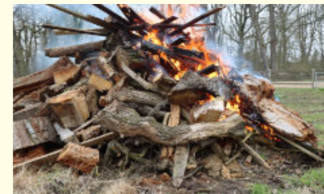
Durch das Umschichten VOR dem Anzünden können im Holz versteckte Tiere flüchten.

Vor allem im ländlichen Raum wird gerne Holz auf dem Dorfplatz gesammelt und gemeinsam an einem der Festtage angezündet. Mit diesem alten Brauch sollen unter anderem der Winter und böse Geister vertrieben werden. Da das Holz oft über mehrere Wochen auf dem Sammelplatz lagert, ist der Haufen ein schönes Versteck zum Beispiel für Mäuse und Igel. Um zu verhindern, dass sie ein Opfer der Flammen werden, muss ein oder zwei Tage vor dem Entzünden unbedingt noch einmal umgeschichtet werden.