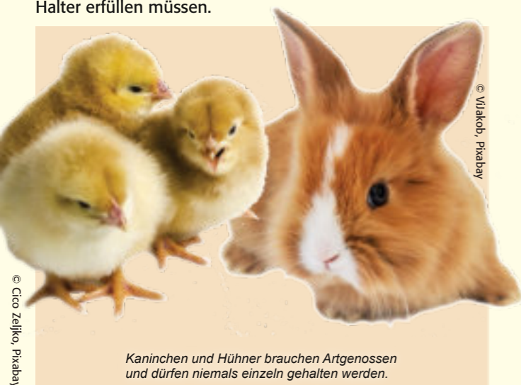
Kaninchen und Hühner brauchen Artgenossen und dürfen niemals einzeln gehalten werden.

Tiere sind immer eine Anschaffung fürs Leben, die gut überlegt sein will. Kaninchen und Hühner können bis zu 10 Jahre alt werden und haben besondere Ansprüche, die Halter erfüllen müssen.