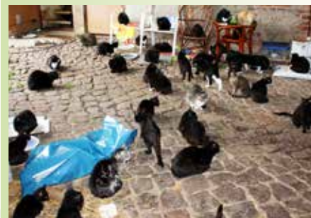
Mit steigender Tierzahl sinkt meist die Qualität der Haltung.