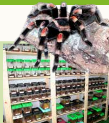
2013 hielt ein Mann fast 1.000 Vogelspinnen in seiner Wohnung.