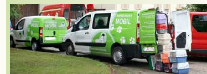
aktion tier bietet den Ämtern individuelle Hilfestellungen an und ist aufgrund seiner räumlichen und logistischen Möglichkeiten auch in der Lage, umfangreichere Tierrettungsaktionen durchzuführen.

Oft versuchen Amtstierärzte, über eine verordnete Bestandsreduzierung Herr der Lage zu werden. In der Regel jedoch ohne Erfolg, denn Tiermessies verstecken häufig Tiere vor einer behördlichen Kontrolle, anstatt diese endgültig abzugeben und nehmen trotz vorgegebener Bestandsobergrenze weiter unkontrolliert Tiere auf, so dass die alten Zustände im Verborgenen bestehen bleiben oder sich sogar noch verschlimmern.