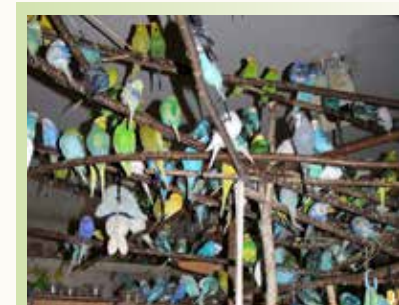
Über 1.700 Wellensittiche hielt ein Mann in seiner Berliner Wohnung.

Bereits im Jahr 1999 hat ein amerikanischer Tierarzt in einer Studie den Begriff „Animal Hoarding“ geprägt und die Vermutung geäußert, dass es sich um eine psychische Erkrankung handelt. 2000 veröffentlichte ein Psychologe dann erstmalig einen Artikel in einer amerikanischen Fachzeitschrift über das Phänomen, dem meistens eine besessen/zwanghafte Persönlichkeitsstörung, aber auch unterschiedliche Formen von Suchtverhalten oder Bindungsstörungen zu Grunde liegen sollen. Bis heute sind weitere Studien zum Thema fast ausschließlich in den USA erschienen.