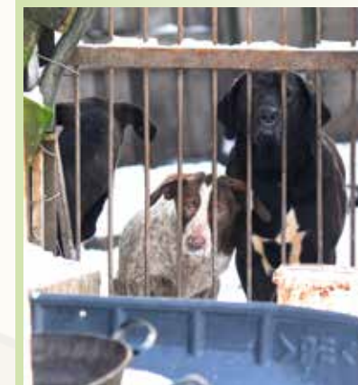
Animal Hoarder geben Tiere nicht freiwillig ab.

Die langsame Eskalation vollzieht sich in der Regel sogar unter den Augen der zuständigen Behörden und involvierter Personenkreise wie beispielsweise Gesundheitsämter, Pflegedienste, Tierärzte, Tierschutz, Polizei und Veterinärämter, die einfach jahrelang wegsehen. Leider wird auch die unreflektierte Sammelleidenenschaft von Tiermessies oft ausgenutzt. Da sie in der Regel immer bereit sind, Tiere aufzunehmen, werden sie häufig von privaten Tierhaltern oder sogar Tierschutzorganisationen als „Abladeplatz“ missbraucht. Manchmal werden sogar Fundtiere durch die Behörden bei Tiersammlern untergebracht, wenn beispielsweise keine offizielle Tiersammelstelle vorhanden ist.