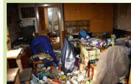
In einer typischen Messie-Wohnung herrscht Chaos.

Menschen, die Dinge sammeln und damit ihre Wohnung vollstopfen, werden als „Messies“ bezeichnet. Ein ganz ähnliches Phänomen, bei dem jedoch anstelle toter Gegenstände lebende Tiere in großer Zahl angehäuft werden, nennt man Animal Hoarding (übersetzt „Tiere sammeln“, „Tiere horten“). Tiermessies sammeln und horten vorrangig Hunde, Katzen, Kleintiere und Exoten wie etwa Schlangen.