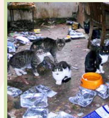
Wegsehen und Ignorieren löst nicht das Problem.