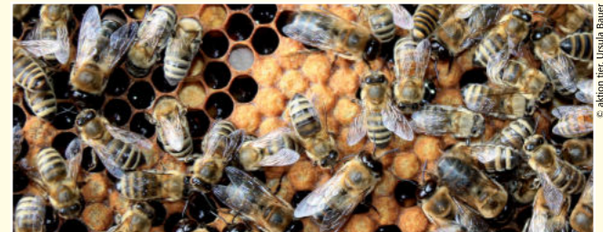
Arbeiterinnen an mit gelbem Wachs zugedeckelten Brutwaben

Ein Bienenvolk ist ein hoch entwickelter, gut organisierter Insektenstaat mit ausgeprägter Arbeitsteilung. Im Winter besteht das Volk aus 10.000 bis 40.000 Individuen, im Sommer kann die Zahl auf bis zu 50.000 Bienen anwachsen. Die meiste Zeit des Jahres lebt nur die Königin mit Tausenden von weiblichen Arbeitsbienen im Stock. Während die einzige Bestimmung der Königin darin besteht, Eier zu legen, haben die Arbeitsbienen viele, streng zugeordnete Tätigkeitsbereiche. Sie sammeln Nektar und Pollen, bringen Wasser in den Stock und ziehen die Brut auf. Die wenigen männlichen Bienen (Drohnen) haben die Aufgabe, die im Sommer herangezuchteten Jungköniginnen während des Hochzeitsfluges zu begatten.