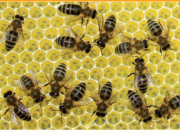
Arbeiterinnen auf Honigwaben