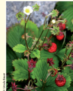
Ohne Bestäubung keine Früchte

Der Nutzen der Biene durch die Bestäubung von Kulturpflanzen ist somit um ein Vielfaches höher als der direkte Nutzen aus Honig und anderen Bienenprodukten. Honigbienen sorgen nicht nur dafür, dass unser Tisch reichlich gedeckt ist, sondern bestäuben auch unzählige Wildpflanzen, die ihrerseits die Nahrungsgrundlage für Wildtiere darstellen. Durch ihre Bestäubungsleistung tragen Honigbienen maßgeblich zum Erhalt der heimischen Tier- und Pflanzenwelt bei.