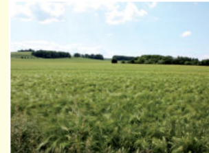
In monotonen Agrarlandschaften finden Bienen keine Nahrung

W eltweit sterben Bienenvölker. Gründe sind Parasiten wie die Varroa-Milbe und der Einzeller Nosema sowie verschiedene Viren und Bakterien. Die gefürchtete Faulbrut, bei der bestimmte Bakterien die Bienenlarven befallen, führt zum Verlust ganzer Bienenvölker. Ein weiterer Faktor ist die intensive Landwirtschaft, denn in unseren monotonen Agrarsteppen finden Honigbienen zu wenige Blütenpflanzen. Auch der verstärkte Einsatz von Pflanzenschutzmitteln bedroht die Bienen. Obwohl die Bienenschutz-Verordnung durch die Regelung des Einsatzes von Pflanzenschutzmitteln die Gefahr für Bienen minimieren soll, führen immer wieder nicht fachgerechte Insektizideinsätze zu verheerenden Bienenvergiftungen. Der Nachweis, dass auch bisher zugelassene Pflanzenschutzmittel für Bienen gefährlich sein können, ist schwer zu erbringen, da sterbende Bienen in der Regel nicht zum Stock zurückfliegen und von den Imkern nicht untersucht werden können. Nicht zuletzt steht auch der bisher nicht bewiesene Verdacht im Raum, dass manipulierte Pflanzen ein Problem für die Honigbiene darstellen könnten. Letztendlich ist auch die Zahl der hauptberuflichen Imker in den letzten Jahren stark zurückgegangen. Erfreulicherweise betätigen sich jedoch immer mehr Menschen als Hobby- oder Nebenerwerbsimker.