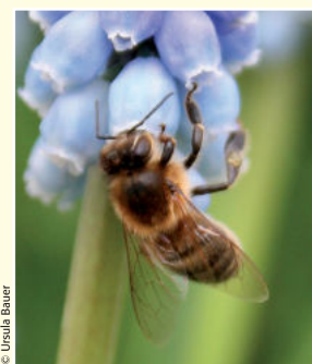
Kärntner Biene (Apis mellifera carnica)

Die Gattung der Honigbiene (Apis) umfasst weltweit 8 Arten, die in größeren Gemeinschaften leben (staatenbildende Arten). In Deutschland kommt nur eine Art vor – die Westliche Honigbiene (Apis mellifera). Bei dieser Bienenart haben sich regional unterschiedliche Rassen herausgebildet. Von größter Bedeutung für die Imkerei war früher die Dunkle Biene (Apis mellifera mellifera), die inzwischen jedoch durch die Kärntner Biene (Apis mellifera carnica) weitgehend ersetzt wurde.