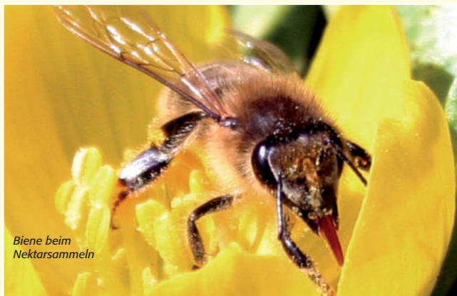
Biene beim Nektarsammeln

Honigbienen produzieren Honig, indem die sogenannten Sammelnbienen den von vielen Pflanzen vorrangig in den Blüten als Lockstoff ausgeschiedenen Nektar mit ihrem langen Rüssel aufsaugen und in ihrer Honigblase speichern. Was sie selbst als Nahrung brauchen wird heruntergeschluckt und verdaut. Der Rest wird in den Bienenstock gebracht und dort an andere Arbeiterinnen weiter gegeben. Schon während des Rückflugs zum Stock fügen die Bienen dem Nektar körpereigene Stoffe wie Enzyme zur Verhinderung von Bakterienwachstum bei und verringern dessen Wassergehalt. Der vorbereitete und eingedickte Nektar wird von den Stockbienen zur weiteren Trocknung in leeren Wabenzellen ausgebreitet. Liegt der Wassergehalt unter 20%, ist der Honig fertig und wird von den Stockbienen in Wachswaben eingelagert. Jede Honigzelle wird mit einer luftundurchlässigen Wachsicht verdeckelt. Der Honig dient der aktuellen Ernährung des Bienenvolkes, der Aufzucht der Brut und als Vorrat für den Winter.