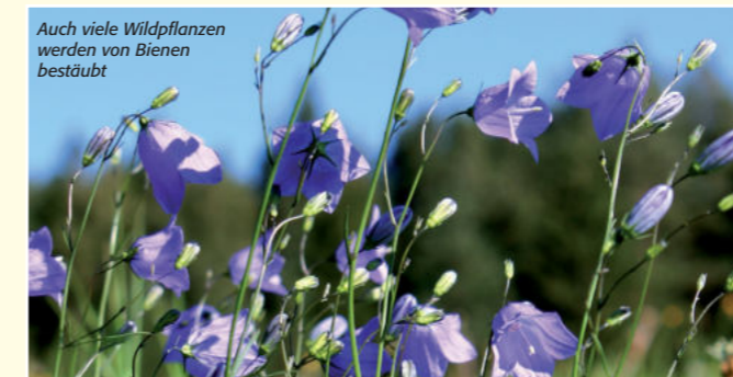
Auch viele Wildpflanzen werden von Bienen bestäubt

Der Nutzen der Biene durch die Bestäubung von Kulturpflanzen ist somit um ein Vielfaches höher als der direkte Nutzen aus Honig und anderen Bienenprodukten. Honigbienen sorgen nicht nur dafür, dass unser Tisch reichlich gedeckt ist, sondern bestäuben auch unzählige Wildpflanzen, die ihrerseits die Nahrungsgrundlage für Wildtiere darstellen. Durch ihre Bestäubungsleistung tragen Honigbienen maßgeblich zum Erhalt der heimischen Tier- und Pflanzenwelt bei.