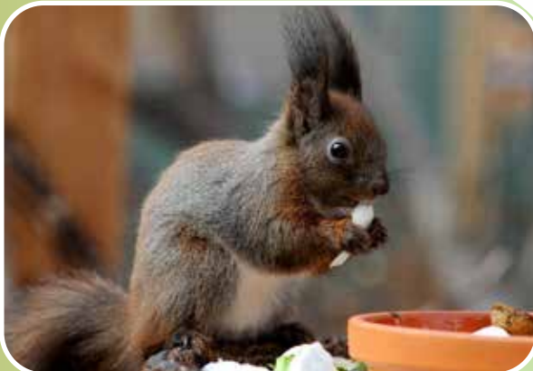
Eichhörnchen beim Fressen

Wenn Eichhörnchen fressen, halten sie die Nahrung in den Vorderpfoten, was für uns Menschen besonders niedlich aussieht. Sie haben eine ganz charakteristische Art, Nüsse zu öffnen oder die Deckschuppen von Zapfen abzubeißen, um an die Samen heranzukommen.