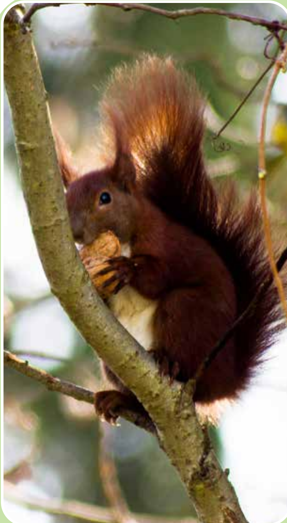
Eichhörnchen beim Sammeln des Wintervorrats

Etwa ab Oktober legen Eichhörnchen ihre Wintervorräte an. Sie vergraben und verstecken jede Menge Nüsse, Bucheckern, Eicheln und andere Pflanzensamen. Das Futter wird im Boden verscharrt, in Astgabeln eingeklemmt oder unter loser Baumrinde deponiert. Eichhörnchen halten keinen durchgängigen Winterschlaf, sondern lediglich eine Winterruhe und benötigen daher für die Wachphasen ausreichend Nahrung. Da viele dieser Nahrungsverstecke von den Tieren vergessen werden, keimen die meisten Samen im Frühjahr. Auf diese Weise sind Eichhörnchen unbewusst hervorragende Gärtner, die dafür sorgen, dass zahlreiche neue Bäume und andere Pflanzen wachsen.