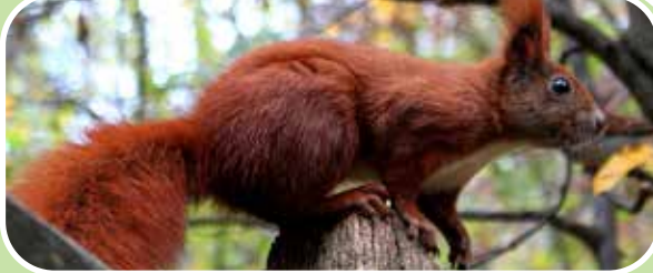
Eichhörnchen in freier Natur

Grundsätzlich gilt für unsere heimischen Eichhörnchen in Deutschland ein Besitz- und Vermarktungsverbot. Leider gibt es jedoch Ausnahmegenehmigungen für einige Züchter, die diese Tiere vermehren und die Nachkommen verkaufen dürfen. Häufig geschieht dies via Internet und die Hörnchen werden auch noch per Post verschickt. Tiere aus diesen genehmigten Nachzuchten dürfen dauerhaft in Gefangenschaft gehalten werden, wobei die gesetzlichen Vorgaben (z.B. Meldepflicht, Kennzeichnungspflicht, Sachkunde und Zuverlässigkeit des Halters) eingehalten werden müssen.