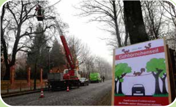
Das Eichhörnchenseil wird befestigt

Immer wieder werden Eichhörnchen überfahren. Vor allem im Herbst und im Frühjahr ist die Gefahr besonders groß, da die Tiere dann mit dem Verstecken von Futter bzw. der Partnersuche derart beschäftigt sind, dass sie dem Straßenverkehr keinerlei Aufmerksamkeit widmen.