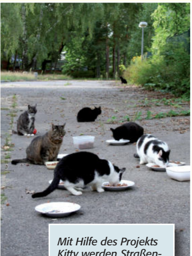
Mit Hilfe des Projekts Kitty werden Straßenkatten eingefangen, medizinisch betreut, kastriert und an überwachenden Stellen wieder frei gelassen.

Durch intensive Aufklärungs- und Öffentlichkeitsarbeit schafft das Projekt Kitty darüber hinaus auch Verständnis für die Straßenkatten und fördert die Bereitschaft in der Bevölkerung, diesen Tieren zu helfen oder neue, bislang nicht kastrierte Katzenpopulationen zu melden.