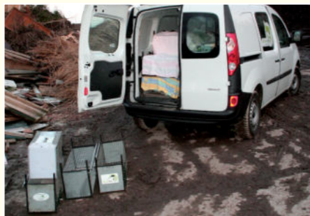
Katzen werden für eine Kastration von aktion tier-Mitarbeitern eingefangen.

gesamten Bundesgebiet helfen. Aber unsere derzeit 20 Kitty-Foren leisten schon jetzt in ihrem Gebiet hervorragende Arbeit. Eine Liste aller Kitty-Foren mit Kontaktdaten finden Sie auf unserer Homepage unter www.aktiontier.org (Rubrik Projekt Kitty/Kitty-Foren).