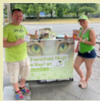
aktion tier klärt die Bevölkerung über den Tierschutz auf! Kommen Sie gerne zu uns!

a aktion tier – menschen für tiere e.V. ist eine der mitgliederstärksten Tierschutzorganisationen in Deutschland. Eine unserer wichtigsten Aufgaben ist es, die Bevölkerung durch Kampagnen und Informationsveranstaltungen auf Missstände im Tierschutz aufmerksam zu machen und Lösungen anzubieten.