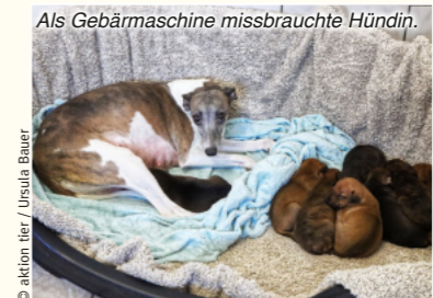
Als Gebärmachine missbrauchte Hündin.

Natürlich gibt es auch hierzulande Menschen, die auf die „Geschäftsidee“ der Hundezucht kommen, sich ein möglichst reinerassiges Tier besorgen und dann eifrig vermehren. In der Regel ohne Sachverstand und ohne die erforderliche Genehmigung nach dem Tierschutzgesetz. Den Großteil der via Internet angebotenen Hundebabys liefern allerdings Händler, die im europäischen Ausland Welpen im ländlichen Raum für wenig Geld einsammeln. Dort hält fast jeder einen unkastrierten Hund und freut sich über ein paar Euro. Daneben kaufen die Händler ihre Ware auch von regelrechten Hundefarmen, wo ganz gezielt viele Rassehündinnen auf engem Raum gehalten werden und permanent gebären müssen.