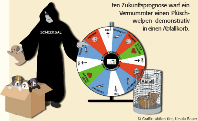
© Grafik: aktion tier, Ursula Bauer