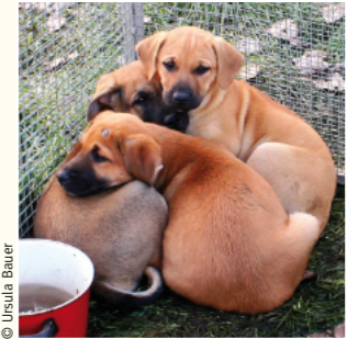
Der lukrative Hundehandel boomt.

Früher holten sich viele Deutsche ihre Hundewelpen auf grenznahen Märkten, zum Beispiel im osteuropäischen Ausland. Heute hat sich das Geschäft fast vollständig ins Internet verlagert, wo man auf Plattformen wie Deine Tierwelt und eBay Kleinanzeigen schnell fündig wird. Schätzungen zufolge sollen monatlich mehrere 10.000 junge Hunde aus ganz Europa online gehandelt werden. Da hierbei immense Gewinne herauspringen, haben Kriminelle komplexe mafiöse Strukturen aufgebaut, gegen die deutsche Behörden weitestgehend machtlos sind. Der organisierte Verkauf von Hunden und Katzen soll inzwischen ähnlich lukrativ sein wie der Drogen- und Waffenhandel. Involviert sind nicht nur die Vermehrer und diverse Zwischenhändler, sondern auch Transporteure und sogar Tierärzte, die falsche Impfpässe ausstellen.