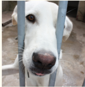
Im Tierheim warten erwachsene Hunde jeden Alters auf Interessenten.

Erwachsene Hunde haben gegenüber dem „jungen Gemüse“ ganz klare Vorteile. Sie sind stubenrein, haben ihre „Ich-muss-alleszerbeißen-Phase“ hinter sich und stehen in der Regel schon mehr über den Dingen. Außerdem müssen sich ältere Vierbeiner gegenüber Artgenossen nicht mehr ständig beweisen und ihre Menschen nicht bei jeder sich bietenden Gelegenheit herausfordern. Wo finden Sie solch ein Goldstück? In jedem Tierheim!