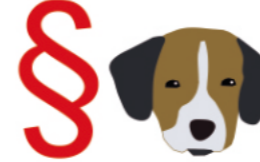
© Grafik: aktion tier, Ursula Bauer