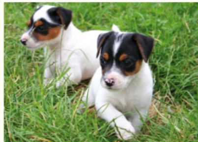
Lassen Sie sich nicht durch schöne Fotos täuschen.

Die im Ausland „produzierten“ Welpen werden hierzulande über Anzeigen im Internet angeboten, die mit niedlichen Fotos garniert sind, damit sich schnell ein Hundefreund unsterblich „verliebt“. Oft stellen die Bilder nicht das angebotene, kranke Tier dar, und es wird meist verschwiegen, dass die Ware aus dem Ausland stammt. Papiere zur Abstammung, Chipnummern und Impfässe sind in den meisten Fällen gefälscht.