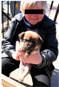
Welpenverkäuferin auf einem Markt in Polen.