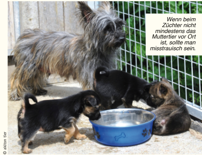
Wenn beim Züchter nicht mindestens das Muttertier vor Ort ist, sollte man misstrauisch sein.