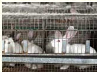
Kaninchen in Drahtkäfigen in der Massentierhaltung.

Sollten Sie sich überlegen, zu Ostern einen Kaninchenbraten aufzutischen, dann denken Sie bitte daran, dass Kaninchen in der konventionellen Mast oft in großen Hallen zu mehreren Tausend Tieren gehalten werden. Hier leben sie in Gruppen von bis zu 8 Tieren in Drahtkäfigen ohne Einstreu. Jedem Tier steht eine winzige Fläche von nur 800 cm 2 zur Verfügung. Das ist etwas mehr als die Größe eines DIN A4-Blattes. Kaninchen können bis zu 10 Jahre alt werden. In der tierquälerischen Intensivmast werden sie jedoch bereits in einem Alter von durchschnittlich 3 Monaten geschlachtet.