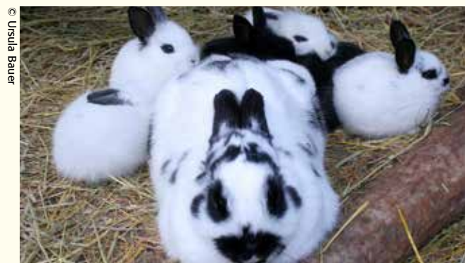
Kaninchen können bis zu 10 Jahre alt werden und dürfen niemals allein gehalten werden. Sie eignen sich nicht als Ostergeschenk, ihre Anschaffung muss gut überlegt werden.

Tiergehege in Einkaufszentren verfolgen natürlich auch den Zweck, Menschen zum Kauf eines Tieres zu animieren. Die Hinweise, dass man die süßen Kaninchen im ansässigen Zooladen kaufen kann, sind meist nicht zu übersehen. Egal ob zu Weihnachten oder zu Ostern – lebende Tiere eignen sich nicht als Geschenk. Selbst wenn ein Kaninchenbaby vielleicht ganz oben auf der Oster-Wunschliste Ihres Kindes stehen sollte. Plüsch ja – lebend nein!