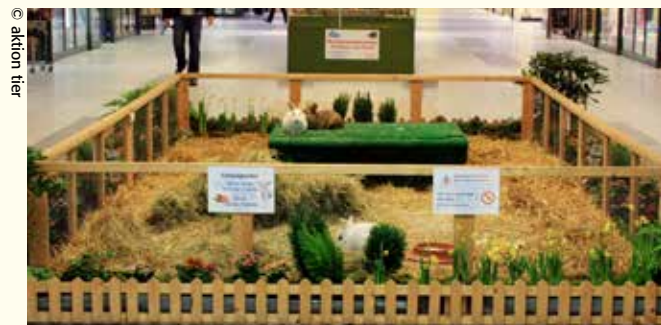
Nicht artgerechtes Kaninchengehege mit viel zu niedriger Umzäunung.

Wenn Sie solche österlichen Tiergehege in Ihrem Einkaufszentrum entdecken, dann äußern Sie bitte Ihre Kritik bei der Centerverwaltung. Der Kunde ist letztendlich König, und jedes Management wird sensibel auf Kundenbeschwerden reagieren.