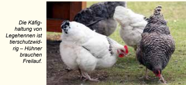
Die Käfighaltung von Legehennen ist tierschutzwidrig – Hühner brauchen Freilauf.

Aber auch das Nachfolgemodell, bei dem jeweils bis zu 60 Tiere in sogenannten Kleingruppen-Käfigen gehalten werden, ist tierschutzwidrig. Jeder Henne stehen in diesem Haltungssystem nur 800 cm 2 Platz (etwas mehr als 1 DIN A4-Blatt) zur Verfügung.