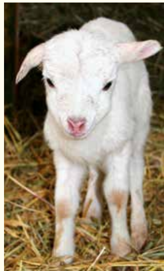
Lammfleisch stammt von Schäfchen, die höchstens 1 Jahr alt werden dürfen.

In vielen Haushalten gehören Gerichte mit Lamm- oder Kaninchenfleisch zum Osterfest dazu. Schafe können ein Alter von bis zu 20 Jahren erreichen. Für die Produktion von Lammfleisch dürfen die Tiere jedoch höchstens 1 Jahr alt werden. Bei der intensiven Lämmermast werden die Lämmchen nur etwa 8 Wochen von den Mutterschafen gesäugt und bereits während der Säugezeit mit Mastfutter zugefüttert. Nach der Trennung vom Muttertier werden die Lämmer in Gruppen meist ausschließlich im Stall gehalten und mit Heu und Kraftfutter gemästet, bis sie im Alter von etwa 4 Monaten ein Schlachtgewicht von 38 bis 43 kg erreicht haben. Nur bei der Weidelämmermast dürfen die Lämmer bei ihren Müttern bleiben und mit der Herde auf der Weide leben. Aber auch in dieser Haltungsform werden sie nach 8 bis 12 Monaten geschlachtet.