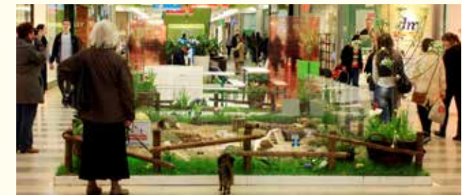
Gehege mit lebenden Tieren in Einkaufspassagen sind Tierquälerei.

Leider werden zu Ostern in vielen großen Einkaufszentren Tiergehege aufgebaut – meist mitten in der Shopping Mall zwischen Rolltreppen, Boutiquen und Verkaufsständen. Besonders Kaninchen und Meerschweinchen, aber auch Hühner- und Gänseküken müssen dort als lebende Dekoration die Besucher erfreuen. Sie sind nicht nur dem grellen Licht und dem dauerhaft hohen Geräuschpegel in der Einkaufspassage schutzlos ausgeliefert. Häufig sind auch die Umzäunungen viel zu niedrig und schützen die Tiere nicht von „Grabschänden“. Außerdem können unvernünftige Menschen jederzeit völlig ungeeignetes und für die Tiere schädliches Futter hineinwerfen. Selbst große Verbotstafeln können dies nicht verhindern.