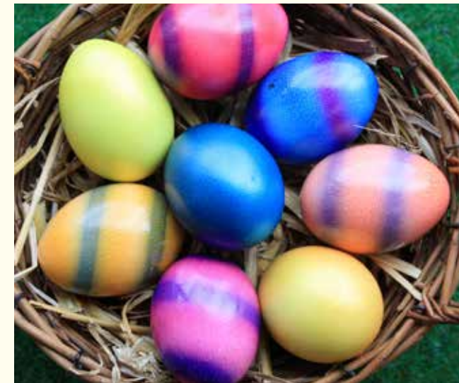
Industriell gefärbte Eier müssen nicht gestempelt werden und stammen meistens von Hennen, die in Käfigen gehalten werden.

Aber auch das Nachfolgemodell, bei dem jeweils bis zu 60 Tiere in sogenannten Kleingruppen-Käfigen gehalten werden, ist tierschutzwidrig. Jeder Henne stehen in diesem Haltungssystem nur 800 cm 2 Platz (etwas mehr als 1 DIN A4-Blatt) zur Verfügung.