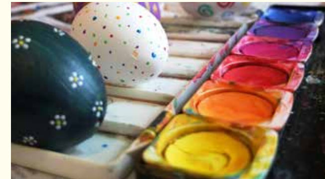
Hartgekochte oder ausgeblasene Eier selbst österlich bemalen macht Spaß. Bitte kaufen Sie auch hier möglichst Bioeier.

Industriell gekochte und gefärbte Eier stammen aus Kostengründen in der Regel von Hennen aus der Käfig-Massentierhaltung. Da diese Eier im Gegensatz zum ungefärbten Schalenei nicht mit dem Eierstempel gekennzeichnet werden müssen, bleibt ihre Herkunft dem Verbraucher verborgen. Daher raten wir grundsätzlich vom Kauf der gefärbten bunten Eier ab.