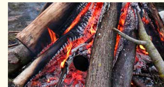
Osterfeuer bitte vor dem Abbrennen umschichten, damit Tiere, die sich darin versteckt haben, flüchten können.

Dieser alte Brauch, den Winter und böse Geister durch ein großes Feuer in der Osternacht zu vertreiben, ist grundsätzlich ein schönes und stimmungsvolles Erlebnis. In den für das Feuer aufgeschichteten Holz- und Asthaufen können sich allerdings Tiere wie Mäuse und Igel verstecken. Um zu verhindern, dass diese Tiere verbrennen, sollten die Haufen vor dem Entzünden unbedingt noch einmal umgeschichtet werden. Bitte weisen Sie die Veranstalter vor Ort auf diesen wichtigen Umstand hin. Sie können dadurch Tierleben retten.